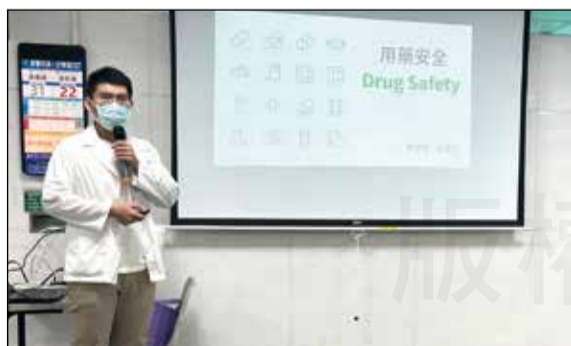
↑藥學生參與用藥安全衛教活動。