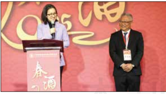
←藥師公會全聯會於3月29日舉辦春酒晚宴，安排跳加官開場，熱鬧滾滾。副總統蕭美琴親臨現場，向藥師表達感謝與祝賀。

【本刊訊】藥師公會全國聯合會於3月29日舉辦年度春酒晚宴，邀請各界貴賓齊聚一堂，共同回顧過去一年的成果，並展望未來發展。副總統蕭美琴親臨現場，向藥師表達感謝與祝賀，同時肯定藥師在全民健康照護中的重要角色。