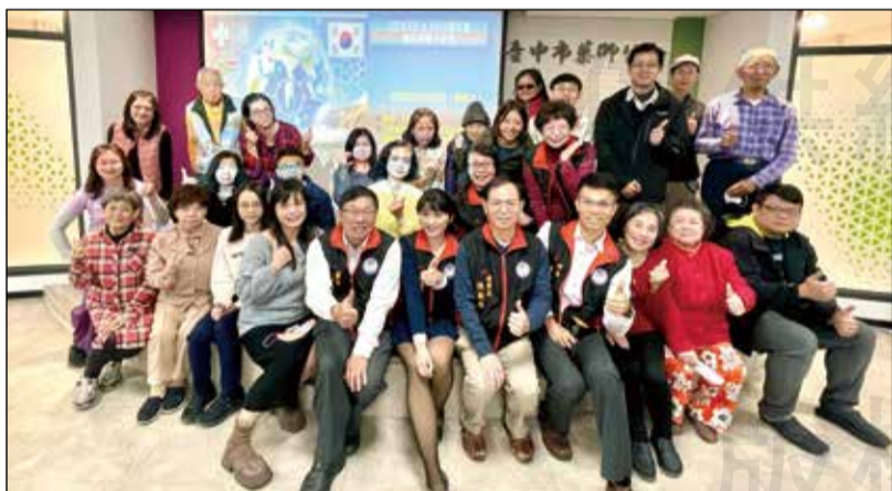
↑臺中市藥師公會舉辦「2024 FIP & FAPA 雙年會創新藥學分享會」。