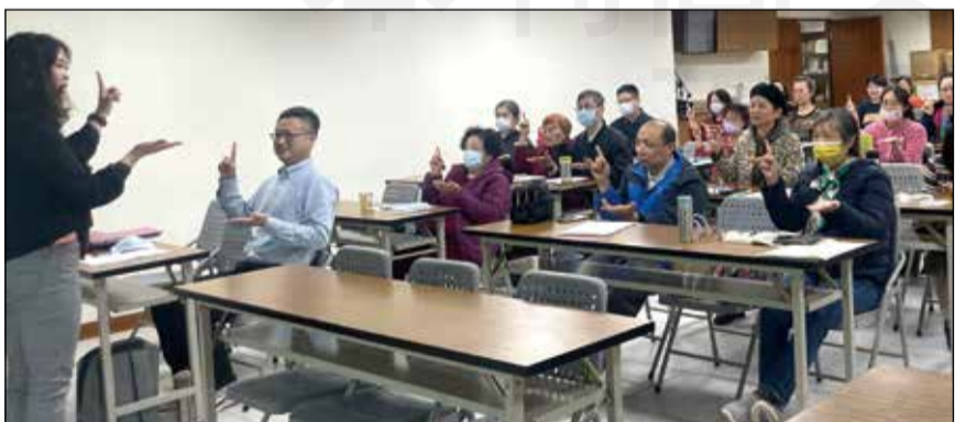
↑桃園市藥師公會繼續教育課程，設計與時事接軌的主題。