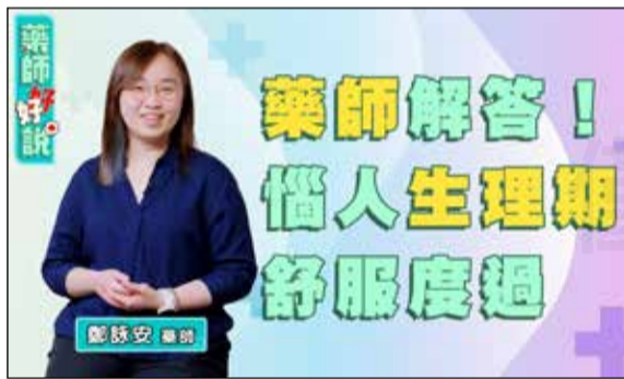
↑面對惱人生理期，藥師教導如何舒服度過。