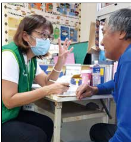
↑台東縣藥師公會派員協助臺灣防盲基金會於3月14、15日舉辦眼睛義診活動。