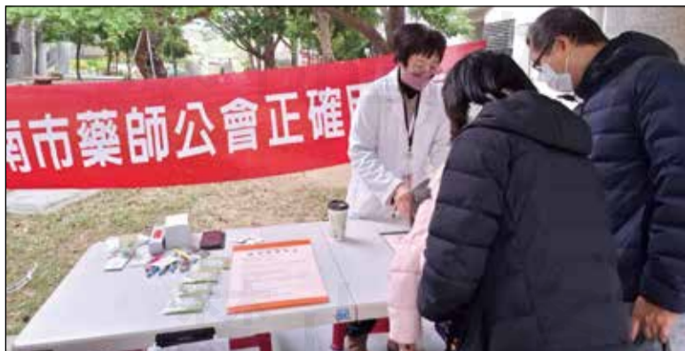
↑臺南市大光國小舉辦校慶活動，台南市藥師公會應邀設攤宣導用藥安全。